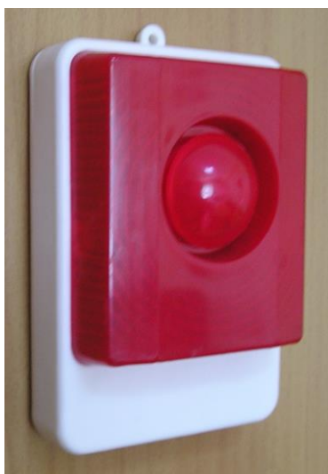
Рис.1 Внешний вид ОСЗ-1 (Ex), исп. 1.

На рис.4 приведен пример подключения оповещателя во взрывозащищенном исполнении ОСЗ-1 Ex.