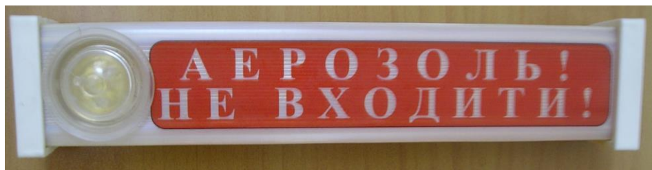
Рис.2. Внешний вид ОСЗ-1 (Ex), исп. 2.